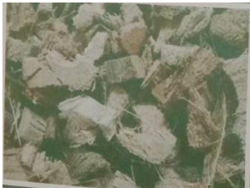
กาบมะพร้าว