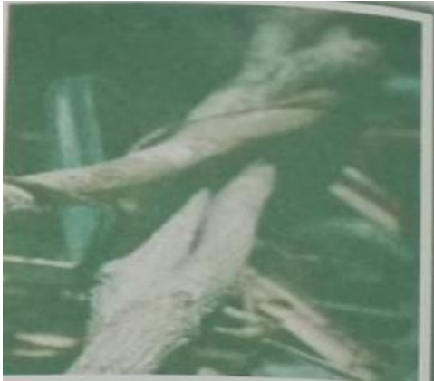
ย่านลำเพ็ญ