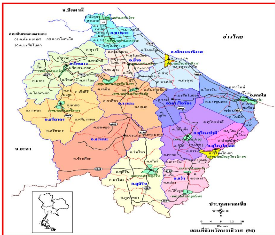
ตาราง : แสดงพื้นที่ของจังหวัดนราธิวาส จำแนกตามรายอำเภอ