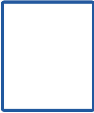
- ว่าง - เจ้าพนักงานประชาสัมพันธ์ ( ปง / ขง )