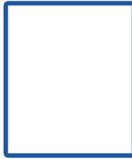
- ว่าง - พนักงานขับรถยนต์