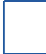
- ว่าง - เจ้าพนักงานธุรการ ( ปง / ชง )