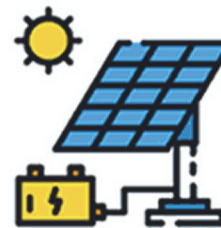
“ลด” การปล่อยก๊าซเรือนกระจก เช่น การใช้เทคโนโลยีและพลังงานสะอาด