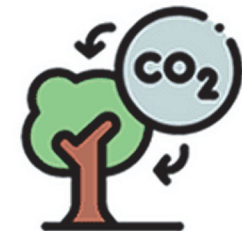
“กำจัด” ก๊าซเรือนกระจกออกจาก ชั้นบรรยากาศ เช่น การปลูกป่า ตรึงคาร์บอนในดิน