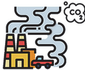
การปล่อยคาร์บอน

ปริมาณการปล่อยคาร์บอนเข้าสู่ชั้นบรรยากาศ เท่ากับปริมาณคาร์บอนที่ถูกดูดซับกลับคืนมา