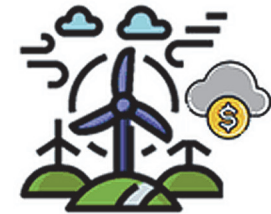
“ชดเชย” การปล่อยคาร์บอนที่เหลือ ด้วยกิจกรรมอื่น เช่น การปลูกป่า หรือ การซื้อคาร์บอนเครดิต

“Net zero emissions” การปล่อยก๊าซเรือนกระจก สุทธิเป็นศูนย์