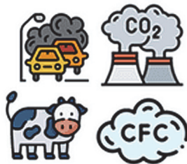
การปล่อยก๊าซเรือนกระจก

ปริมาณการปล่อยก๊าซเรือนกระจกเข้าสู่ ชั้นบรรยากาศเท่ากับปริมาณก๊าซเรือนกระจก ที่ถูกดูดซับกลับคืนมา