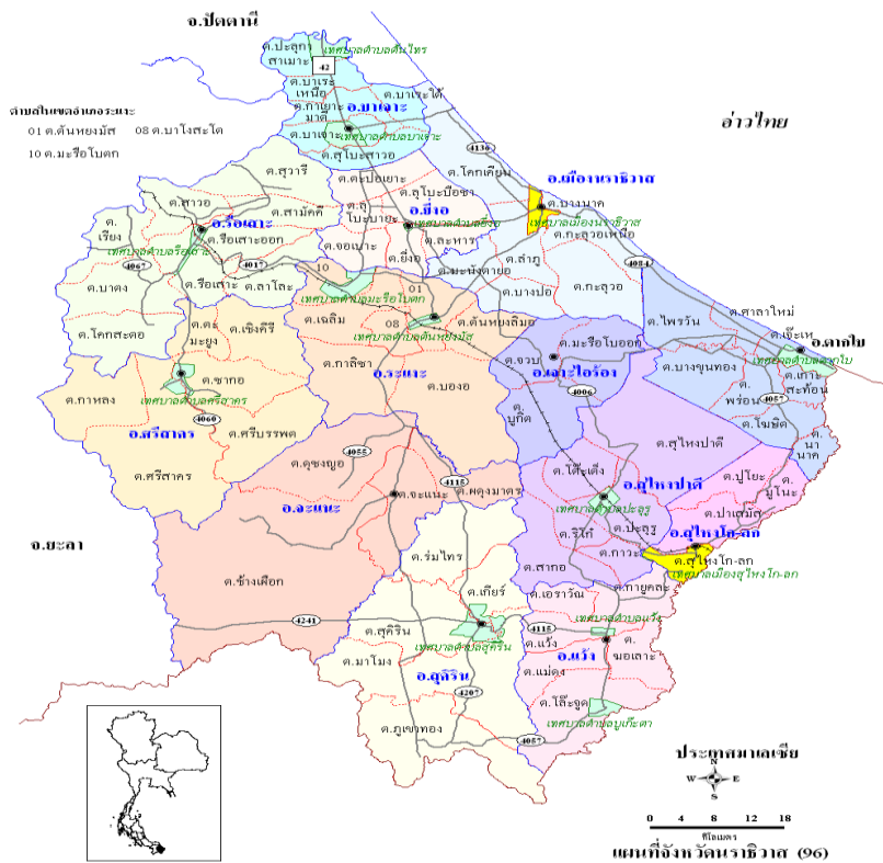
ตารางแสดง : พื้นที่ของจังหวัดนราธิวาส จำแนกรายอำเภอ